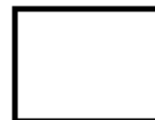
Aufsichtseite des Präparats